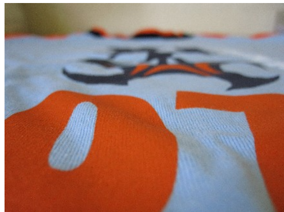
Serigrafía a 3 colores