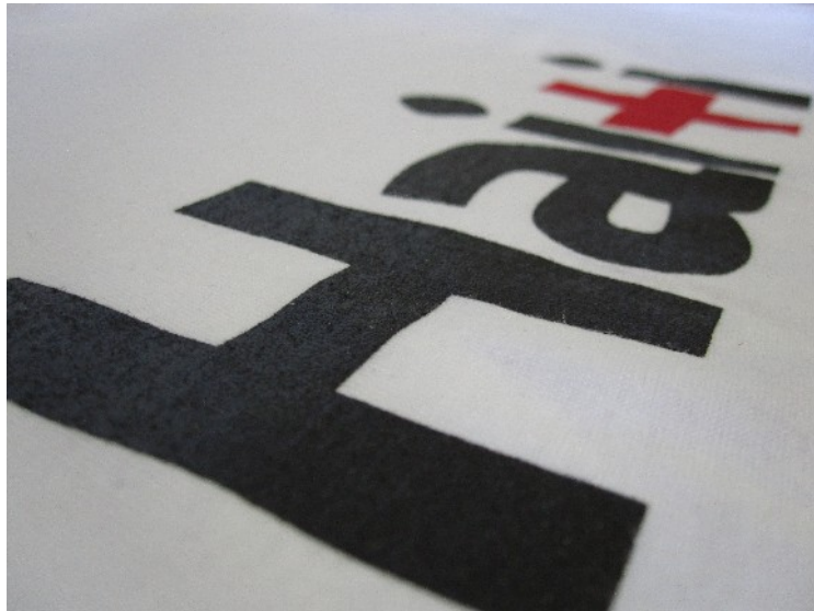
Colaboración con Graffica.info a dos colores

Te informamos que previa consulta, en algunas épocas del año, aceptamos prendas del cliente para estampar en serigrafía. El pedido mínimo que aceptamos por estampado es de 100 prendas o cobramos el importe equivalente.