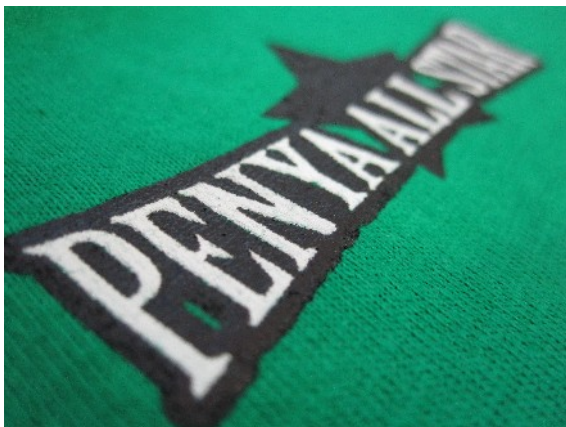
Camiseta para Peña serigrafiada a 2 colores

Trabajamos con pantallas de metal especiales para nuestras máquinas. En raras ocasiones aceptamos que los clientes nos traigan sus pantallas. La estampación de las camisetas de costura a costura se llama Fullprint y se tiene que hacer antes de confeccionar las prendas. Desde que dejamos de fabricar camisetas, ya no podemos dar este servicio; sin embargo, nuestros comerciales le indicarán soluciones alternativas cuando sea posible.