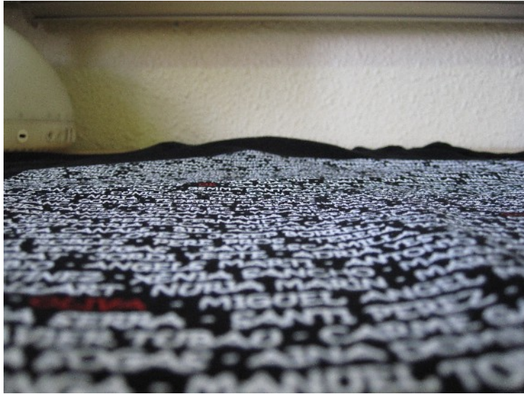
Camiseta para club con el nombre de todos los socios