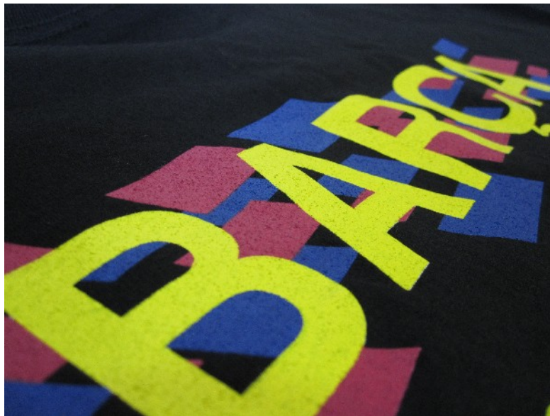
Camiseta para peña en serigrafía a 3 colores